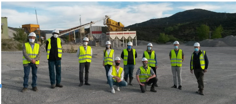
Visita a la explotación de áridos "Las Suertes" de la empresa Jaime López Maquinaria