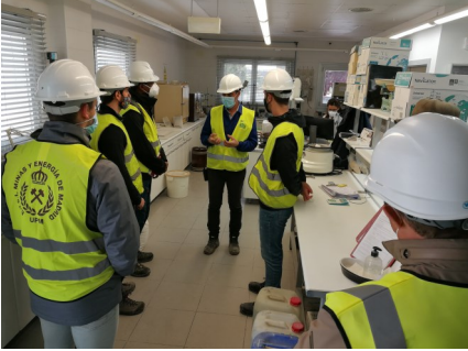
Visita a las instalaciones de Euroarce Minería