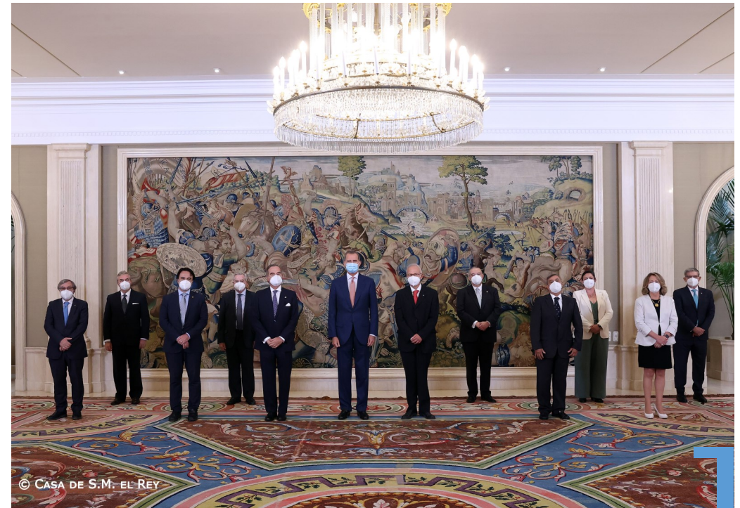
Su Majestad el Rey Felipe I recibiendo a la Junta Directiva de la UICM.

En el transcurso de la Audiencia, que ha tenido lugar en el Palacio de la Zarzuela, los representantes de las profesiones madrileñas han transmitido al monarca la importante labor que se realiza diariamente desde los distintos Colegios Profesionales miembros de la Asociación, resaltando el valor y la potencialidad de que todas las profesiones trabajen unidas bajo el paraguas de UICM, en pro de la sociedad madrileña y española.