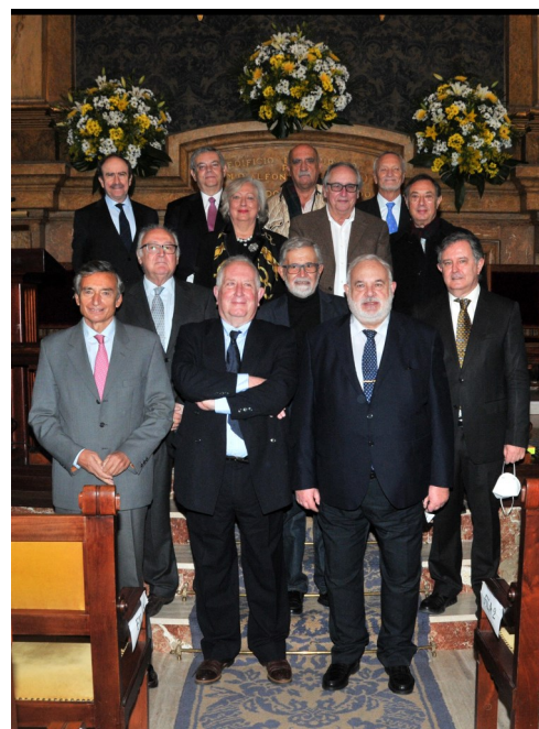
Premiados con la insignia de oro

A quienes trasladamos nuestra enhorabuena y felicitación más cordial.