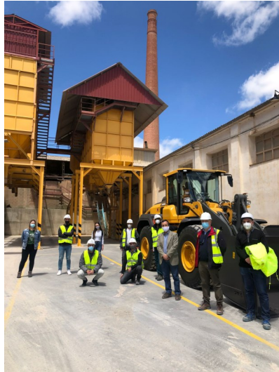
Visita a la empresa Sílices Gómez Vallejo